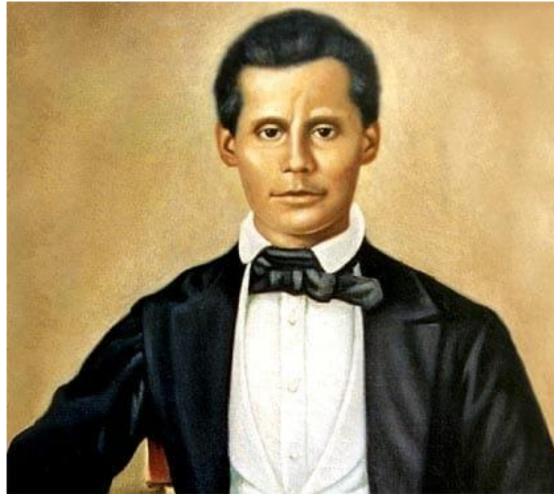
Francisco del Rosario Sánchez

(Santo Domingo, 1817 - San Juan de la Maguana, 1861) Político y líder independentista dominicano, considerado uno de los Padres de la Patria. Miembro de «La Trinitaria», sociedad secreta separatista, en 1844 lideró un alzamiento contra Haití y el 27 de febrero de ese año proclamó la independencia de la República Dominicana. Al igual que otros trinitarios, Francisco del Rosario Sánchez fue apartado del poder y desterrado una vez alcanzada la independencia. Con la amnistía de 1848 pudo regresar al país, y a lo largo de la siguiente década desempeñó diversos cargos públicos. En 1861 entregó su vida en la lucha para evitar la anexión de la República a España.